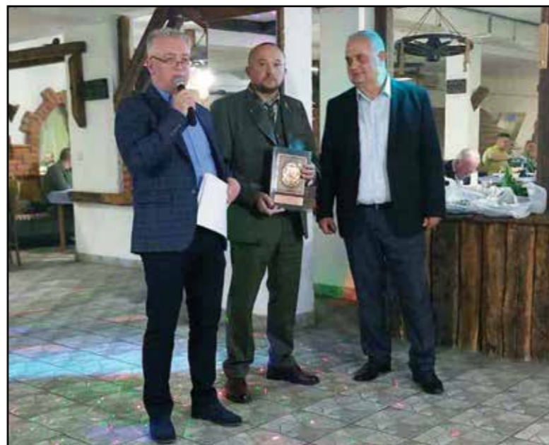
Lovačko društvo „Srndač“ Gračanica