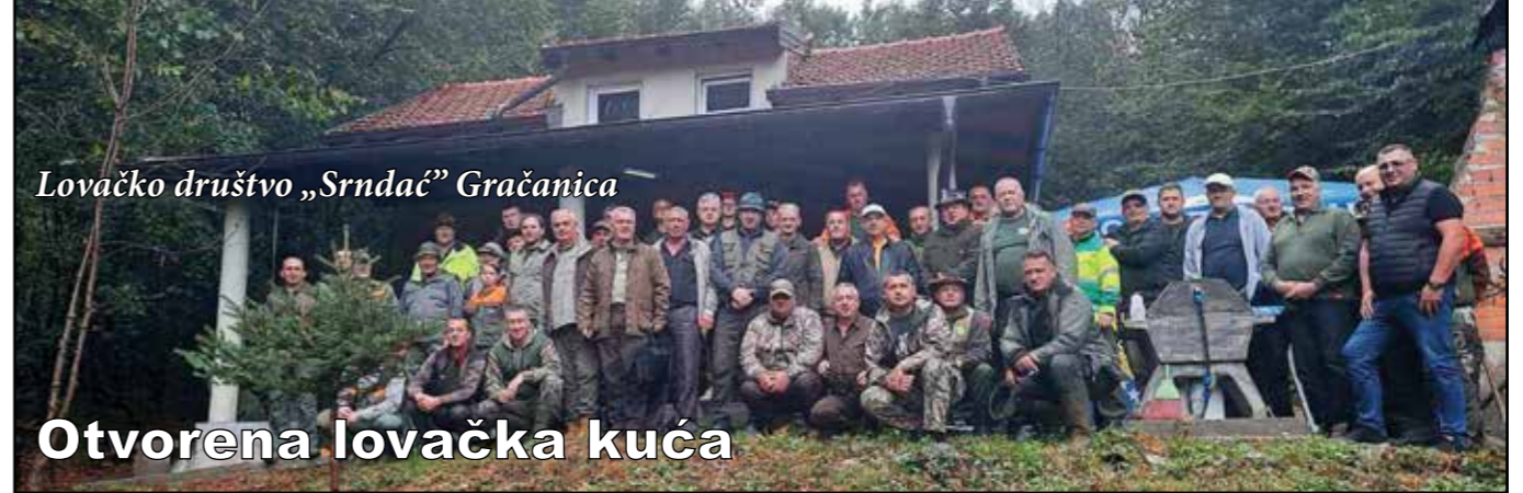
Lovačko društvo „Srndač“ Gračanica